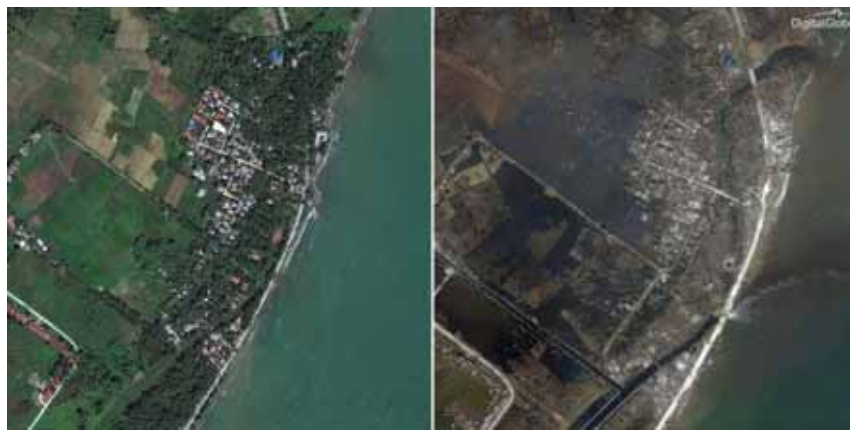
此為災害監測衛星拍攝到的受災前後對比圖。